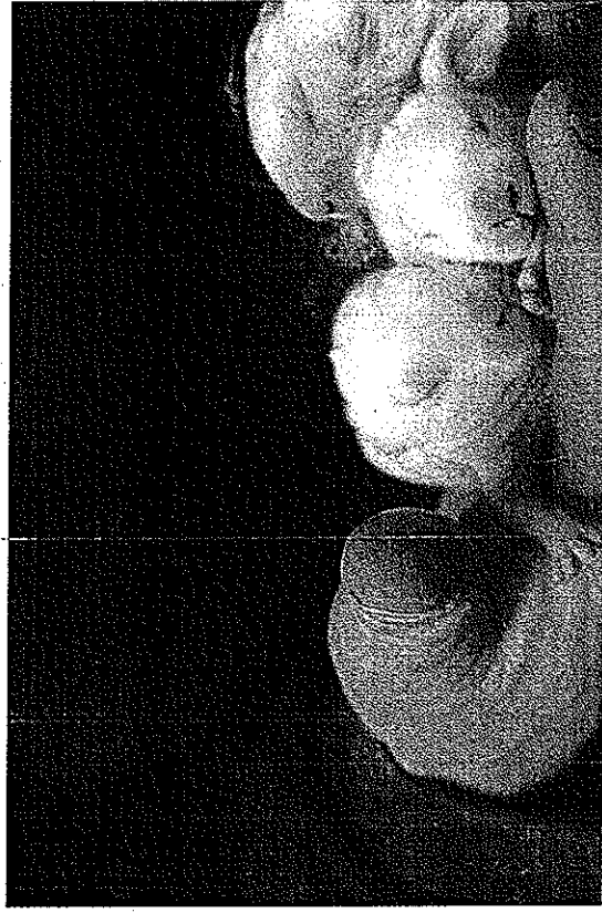
Met een goede zorg en verantwoorde middelenkeuze blijven konijnen gezonder met minder medicijnen.